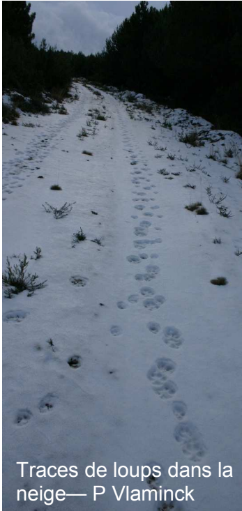
Traces de loups dans la neige— P Vlaminc