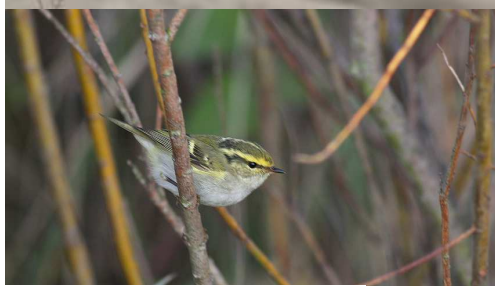
Pouillot de Pallas (Julien Boulanger)