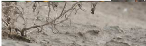
Gobemouche nain (Julien Boulanger)