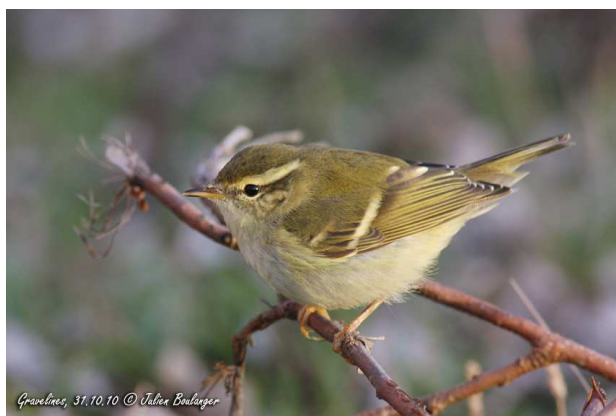
Pouillot à grands sourcils : ce petit passereau de quelques grammes, originaire de Sibérie orientale et de Chine, et censé hiverner en Thaïlande, s'égaré chaque année en nombre variable en Europe occidentale. (Julien Boulanger).

Deux espèces potentielles pour notre séjour, emblématiques de la notion d'oiseau rare en automne.