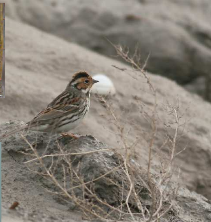
Bruant nain (J.A. Leclercq)

En automne, par un phénomène de dispersion encore méconnu, un certain nombre d'espèces de passereaux d'origine orientale (Sibérie) apparaissent ponctuellement en Europe occidentale : Pipit de Richard, Pipit à dos olive, Tarier de Sibérie, Pouillot de Pallas (en vignette), Gobemouche nain (en vignette), Bruant nain.(en photo).. Autant d'espèces potentielles pour notre séjour.