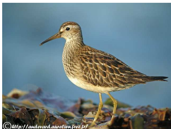
Bécasseau tacheté : limicole d'origine néarctique, le plus régulier des limicoles américains égarés en Europe en automne. (Aurélien Audevard).

Le déroulement du programme peut être modifié par le guide en fonction des circonstances locales et des opportunités. Certaines activités peuvent être déplacées dans le temps, ou remplacées par d'autres