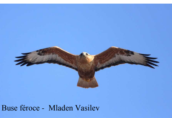
Buse féroce - Mladen Vasilev

Ce voyage nous permettra de profiter des chants et parades des oiseaux sédentaires et des migrateurs qui nichent précocement.