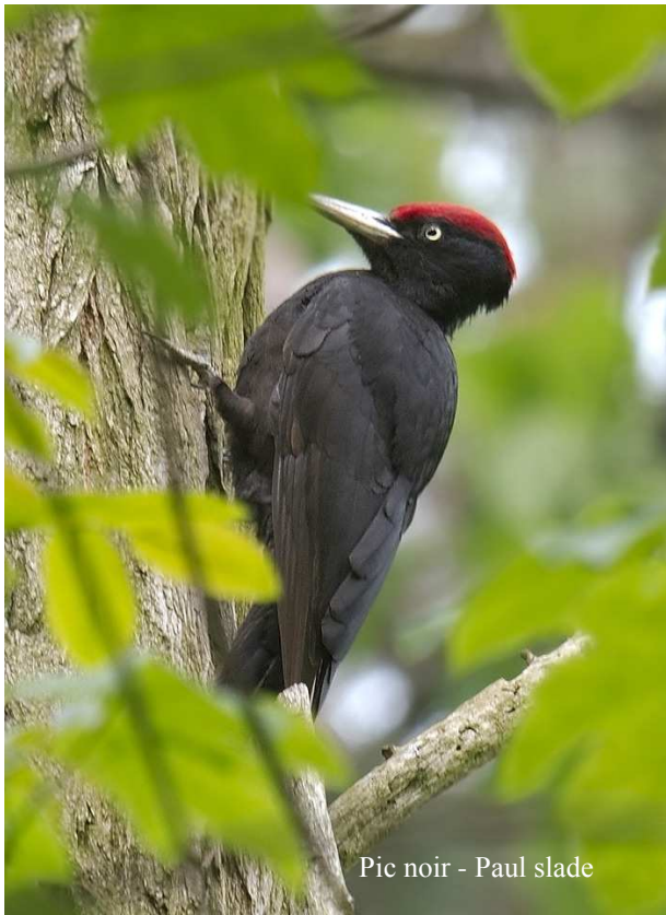
Pic noir - Paul slade