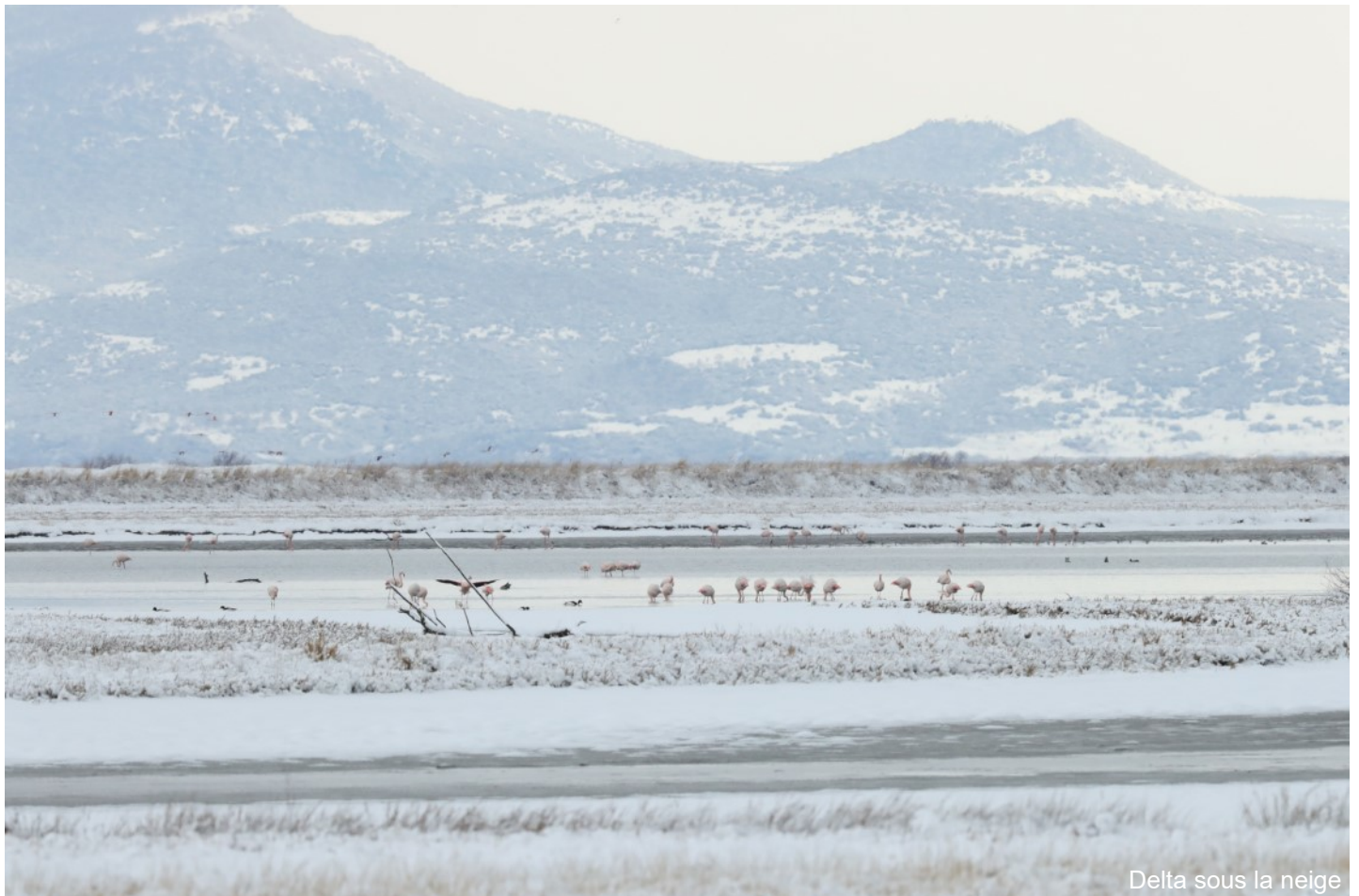
Delta sous la neige

Trois autres aigles approchent, plus petits, leur allure est bien différente. Ils sont très foncés et tiennent les ailes inclinées vers le bas. Ils se trahiront peut-être par quelques jappements: les Aigles criards ont quitté leur taïga reculée pour le delta. L'Aigle impérial affectionne également ce territoire où la nourriture ne manque pas, et plusieurs individus, souvent immatures, passent ici les mois d'hiver. L'observateur doit rester sans cesse attentif, car les surprises se succèdent: nous sommes sur de premier site d'hivernage de la voie de migration orientale !